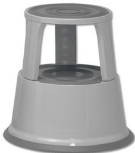
pilka RAL7012 WED212112