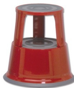
raudona RAL3000 WED212102