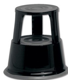
juoda RAL9005 WED212101