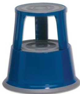
mėlyna RAL5002 WED212103