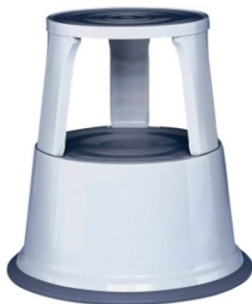
šviesiai pilka RAL7035 WED212137